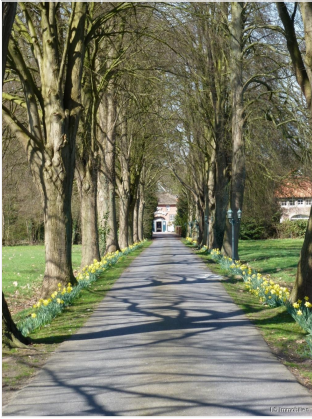
Allee im fröhling